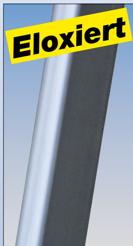
Eloxierte Steig- und Stützholme verhindern das Verschmutzen der Hände