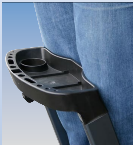
Ergonomisch geformte Ablageschale für bequemeres Arbeiten