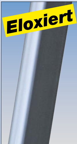
Eloxierte Steig- und Stützholme verhindern das Verschmutzen der Hände