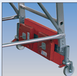
Stabilita vďaka závažiu